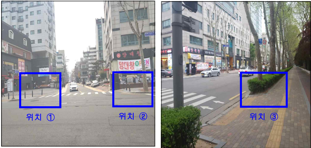
송리단길 조형물 설치 예정위치